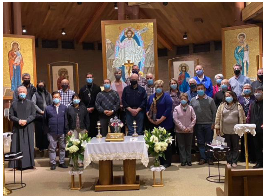
Photo taken at St. Stephen Ukrainian Church